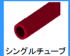
シングルチューブ