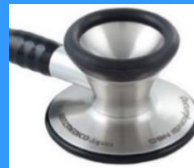
ドクターフォネット ネオⅢ

ドクターフォネットネオⅢは、フレアーフォネットⅢと比べ面積が大きく、ベルの堀が大きいです。よりしっかりと音を拾います。