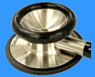
フレアーフォネットⅢ