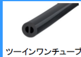
ツーインワンチューブ

ドクターフォネットネオⅢは、1本のチューブの中に2つの通り道があるツーインワンチューブ。音の干渉や減衰が少ない仕様です。フレアーフォネットⅢは、一般的なシングルチューブになります。