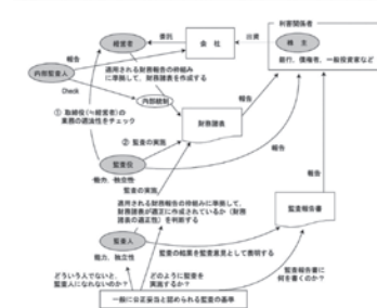
2. 財務諸表監査(一般目的の財務諸表)に対して適正性に関する意見を表明する監査とは (19年9月 編改20)

図や表を多く用い 、考え方を押さえやすくすることで、記憶にのこりやすい「理解」を促します。