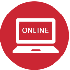
フレキシブルな 受講スタイル