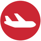
飛行適性検査対策