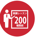
200 種類超の開講レッスン オーダーメイドの カリキュラム