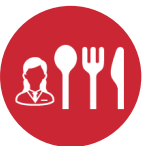
個別食生活 管理&指導