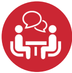
マンツーマンの サポート体制