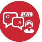
先生にリアルタイムで 質問できる 筆記試験対策 フォローアップ体制