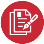
エントリーシート添削