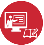
筆記試験対策 WEB 動画