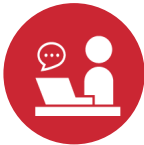
双方向レッスンによる 面接練習&指導 受け放題

最短距離で JAL、ANA 等航空会社に入社することを目的とする方向けのコース。航大受験に必要とされる物理、数学等は除き、自社養成パイロットとエアライン総合職の採用試験に含まれる内容のみに特化します。面接、筆記試験対策、日々の食事管理・指導、第一印象アップのためのグルーミング等、自社養成パイロットとエアライン総合職の採用試験突破に必要なことは網羅しています。