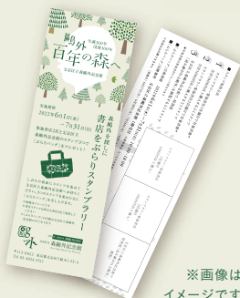
※画像は イメージです

しおりの裏面にスタンプを集めて文京区立森鷗外記念館へお持ちください。3つのスタンプを集めた方に「ぷらりバッグ」を差し上げます。