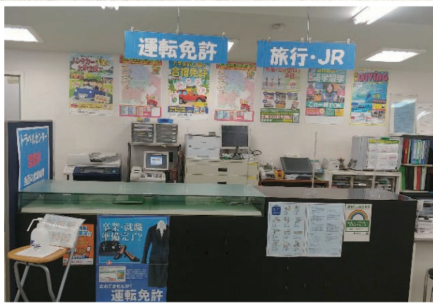
第二購買部に仮移転している本郷トラベルセンター