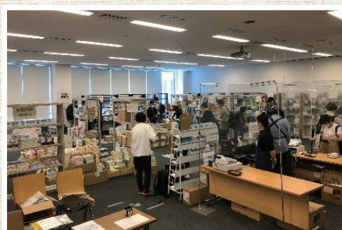
予約受け取りと宅送に取り組んだ教科書販売特設会場（駒場書籍部）