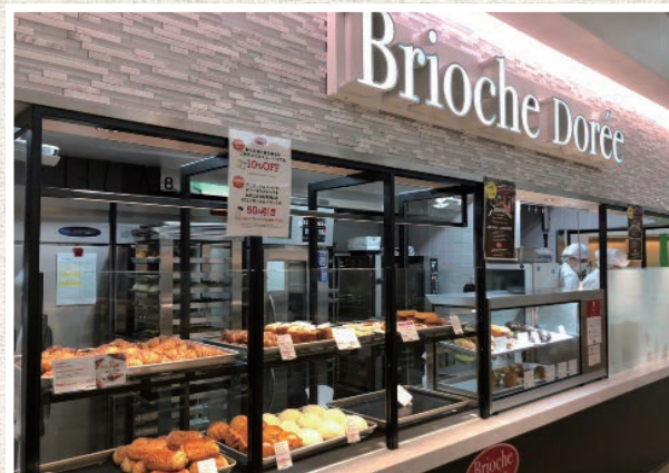
中央食堂コーナーにオープンしたブリオッシュドール