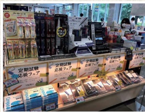
学生の新生活準備に合わせた店舗作り・品揃え（駒場購買部）

7 生協の在庫検索システムの活用を広く呼びかけつつ、書籍15%オフバンドルセールを実施しました（7月～8月）。