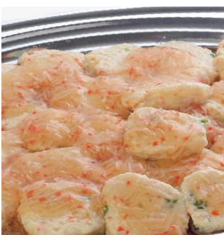
白身魚のふわふわ豆腐 2,800 円