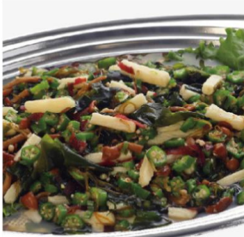
オクラと山芋のねばねばサラダ 3,600 円