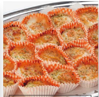
海老のカップグラタン 3,300 円