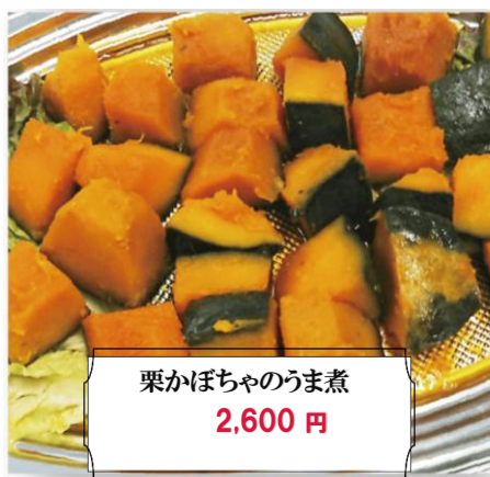
栗かぼちゃのうま煮 2,600 円