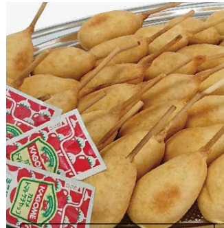
ミニドック 5,500 円