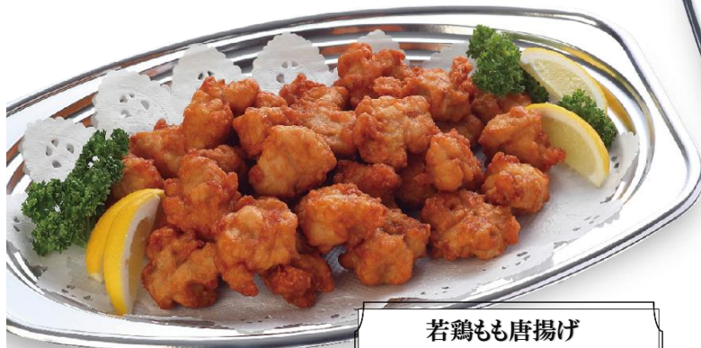
若鶏もも唐揚げ 2,800 円