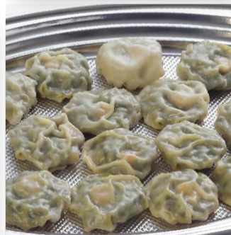
海老ニラまんじゅう 4,600 円