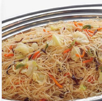
五目焼きビーフン 3,000 円