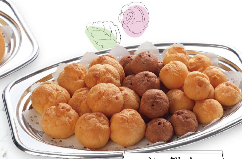
シュークリーム 3,200 円