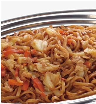
焼きうどん 2,600 円