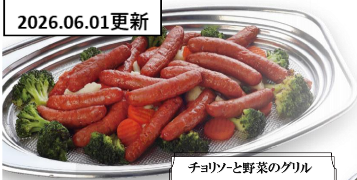
チョリソと野菜のグリル 4,700 円