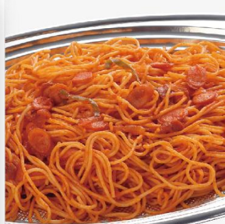
ナポリタン 2,600 円