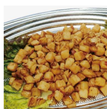
ジャーマンポテト 2,300 円