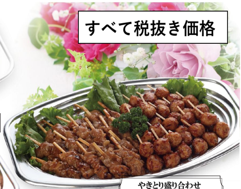
やきとり盛り合わせ 4,000 円