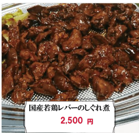
国産若鶏レバーのしぐれ煮 2,500 円