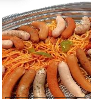
5種のウィンナー盛り合わせ 4,700 円