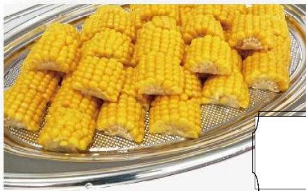
カットコーン 1,700 円