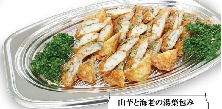
山芋と海老の湯葉包み 6,300 円