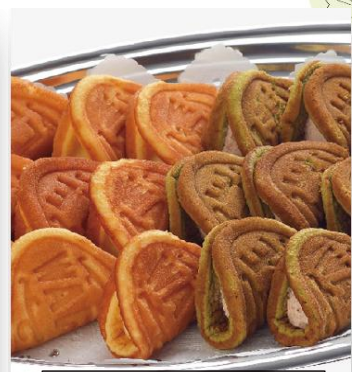
ワッフル (抹茶&メープルクリーム) 3,200 円