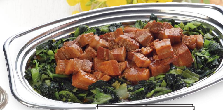
豚角煮 5,000 円