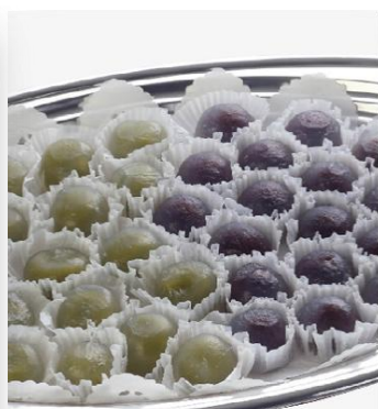
くずもち 3,200 円