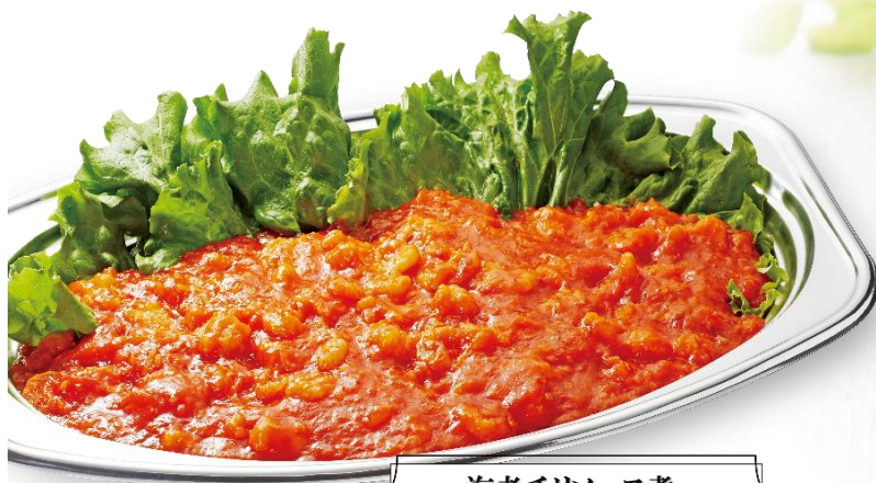
海老チリソース煮 4,400 円