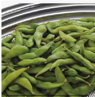
枝豆 1,150 円