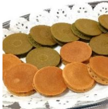
ミニパンケーキ (きなこ黒糖みつ&抹茶) 1,900 円