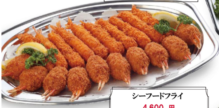
シーフードフライ 4,600 円