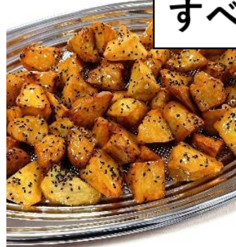
大学いも 3,300 円