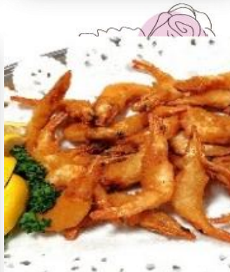
殻ごとカリっうまシュリンプ 3,900 円