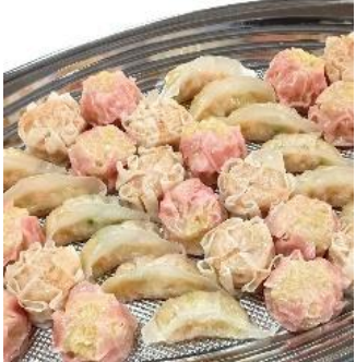
点心3種盛り合わせ 3,500 円