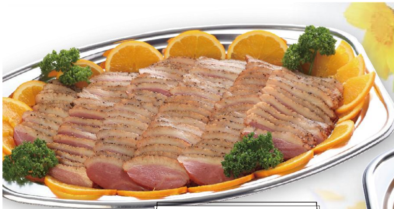
鴨のペッパー風味 4,500 円