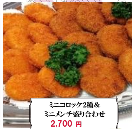
ミニコロッケ2種& ミニマンチ盛り合わせ 2,700 円