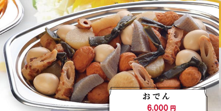
おでん 6,000 円 ※10月～2月限定