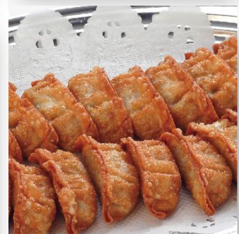
揚げ餃子 2,600 円