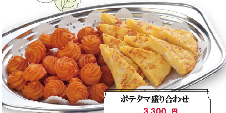
ポテタマ盛り合わせ 3,300 円