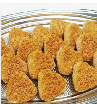
焼きおにぎり 4,300 円