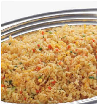
五目チャーハン 2,900 円