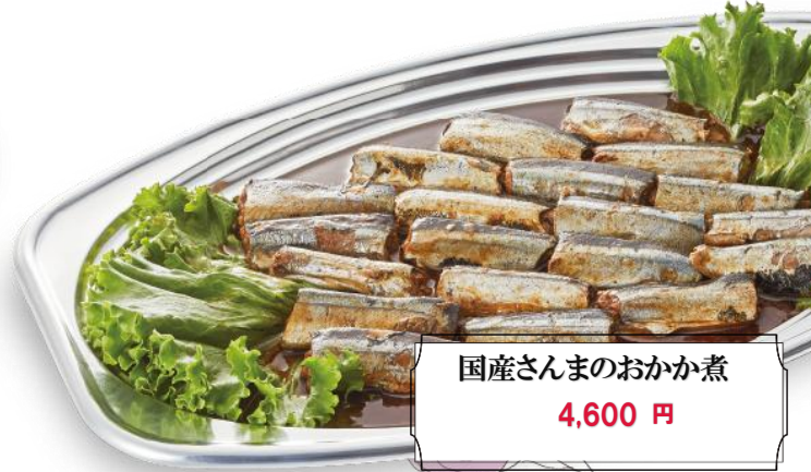
国産さんまのおかか煮 4,600 円