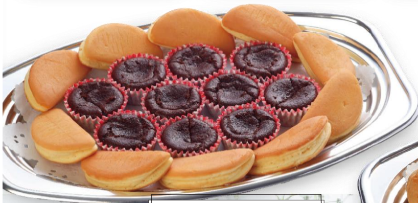
クリームコンフェ &ガトーショコラ 3,400 円