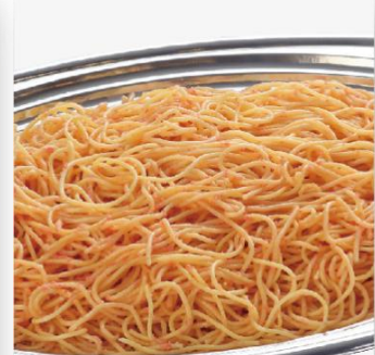
明太子スパゲティー 2,600 円