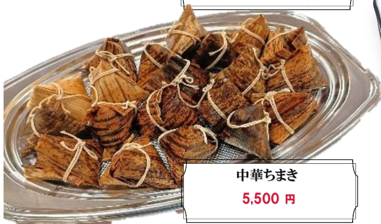
中華ちまき 5,500 円