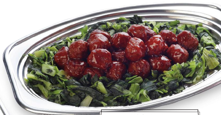
照焼き肉団子 2,700 円