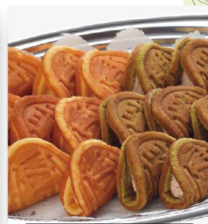
ワッフル (抹茶&メープルクリーム) 3,100 円