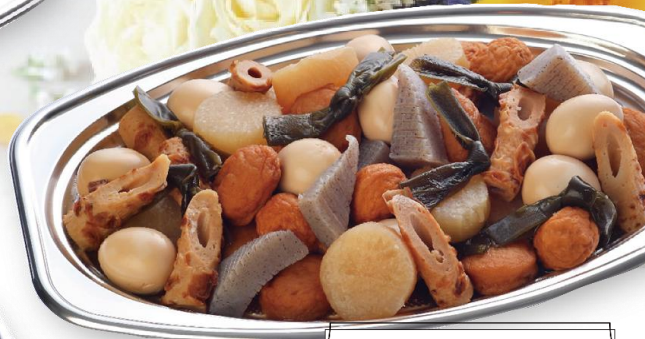
おでん 6,000 円