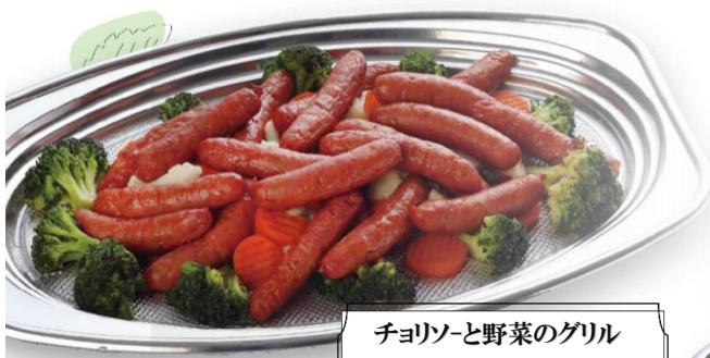
チョリソーと野菜のグリル 4,700 円