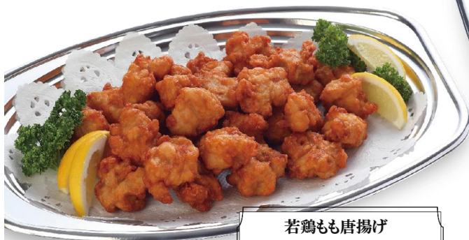
若鶏もも唐揚げ 2,800 円