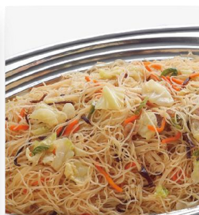
五目焼きビーフン 2,900 円