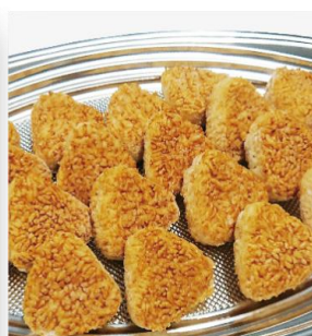
焼きおにぎり 2,900 円