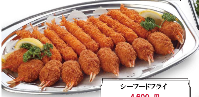
シーフードフライ 4,600 円