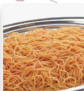
明太子スパゲティー 2,600 円