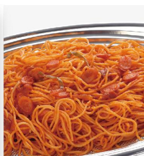
ナポリタン 2,600 円