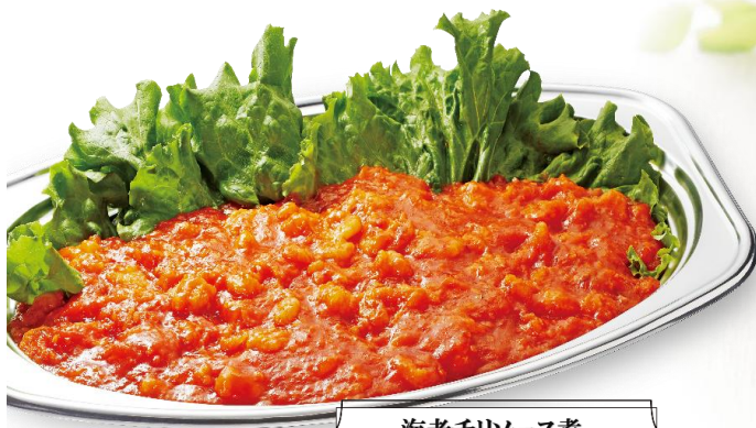
海老チリソース煮 4,000 円