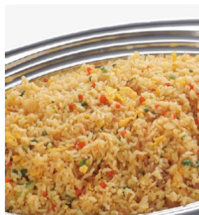
五目チャーハン 2,300 円