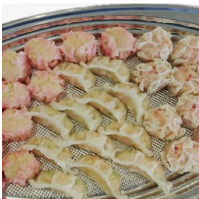
3種点心盛合わせ 3,500 円