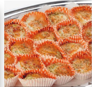
海老のカップグラタン 3,200 円