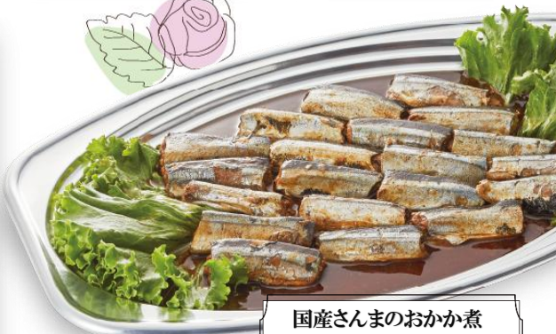
国産さんまのおかか煮 4,600 円