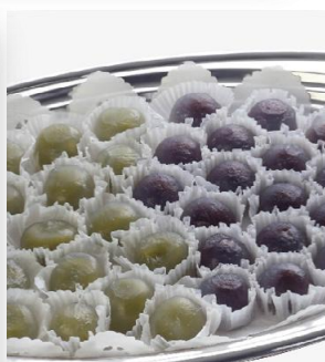
くずもち 2,900 円