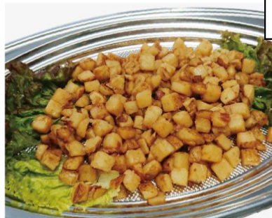
ジャーマンポテト 2,300 円