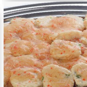
白身魚のふわふわ豆腐 2,800 円