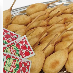
ミニドック 5,500 円