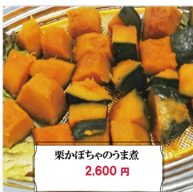
栗かぼちゃのうま煮 2,600 円