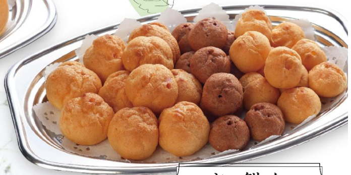
シュークリーム 3,200 円