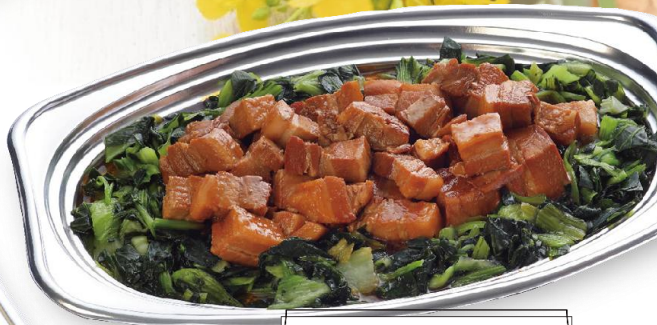
豚角煮 4,700 円