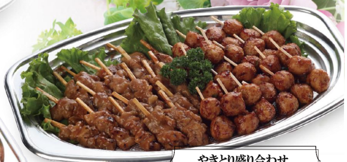
やきとり盛り合わせ 4,000 円