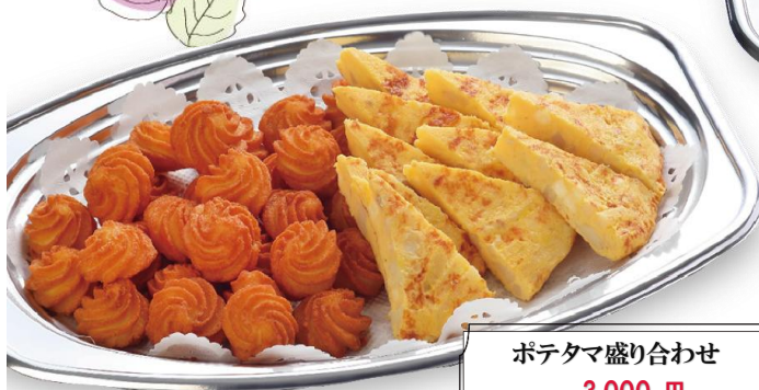
ポテタマ盛り合わせ 3,000 円