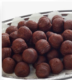
ショコラプチケーキ 2,700 円