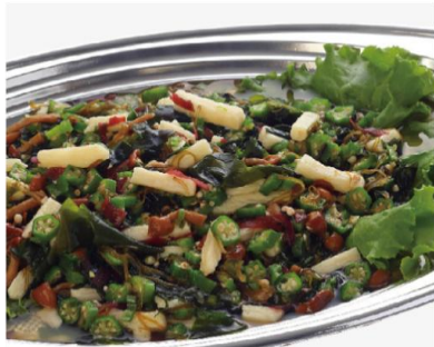
オクラと山芋のねばねばサラダ 3,600 円