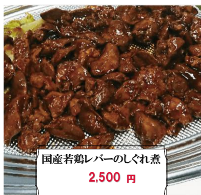
国産若鶏レバーのしぐれ煮 2,500 円