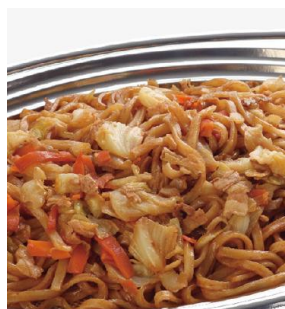
焼きうどん 2,600 円