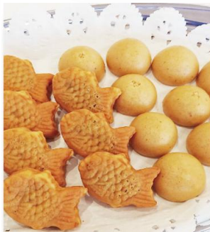
味噌まんじゅう&ミニたい焼き 3,100 円